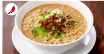
タンタン麺 担々麺 / Spicy Sesame and Peanut Noodle Soup