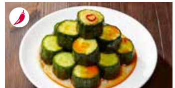
きゅうりの甘辛漬け 辣味黄瓜 / Spicy Pickled Cucumber