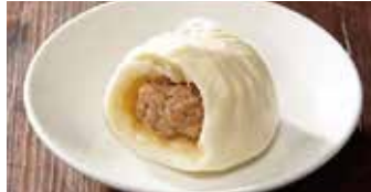
豚肉入りまんじゅう 鮮肉大包 / Pork Bun