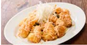
小えびのフリッター マヨソース 沙拉蝦仁 / Prawn Fritter with Mayonnaise Sauce