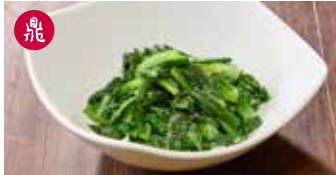
A菜炒め ニンニク風味 炒A菜 / Stir-Fried Taiwanese Lettuce