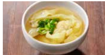
えびと豚肉入りワンタンスープ 蝦肉餛飩湯 / Shrimp and Pork Wonton Soup