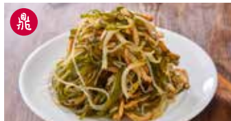
豆腐干と昆布のあえもの 小菜 / Din Tai Fung House Special