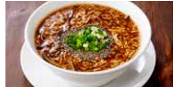
サンラータン麺 酸辣湯麵 / Hot and Sour Noodle Soup