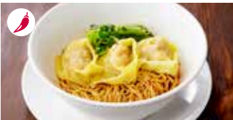
ピリ辛ワンタンあえ麺 (スープ付) 紅油餛飩麵 / Noodle with Spicy Shrimp and Pork Wonton