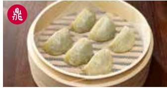
野菜と豚肉入り蒸し餃子 菜肉蒸餃 / Steamed Vegetable and Ground Pork Dumplings