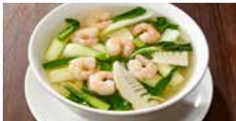
えび麺 蝦仁麵 / Shrimp Noodle Soup