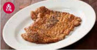
パイター (豚肉の香り揚げ) 炸排骨 / Fried Pork Chop