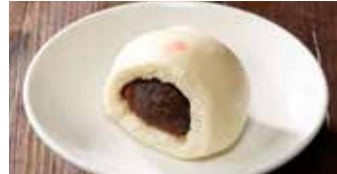
あん入りまんじゅう 豆沙大包 / Red Bean Bun