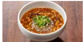
サンラータン 酸辣湯 / Hot and Sour Soup