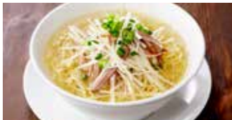
ねぎチャーシュー麺 葱叉焼麵 / Roast Pork and Leek Noodle Soup