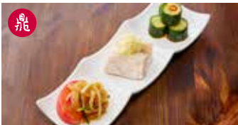
前菜3種盛り 冷菜拼盤 / Assorted Appetizer