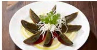
ピータン 松花皮蛋 / Aged Duck Eggs