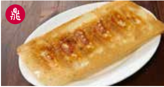
えびと豚肉入り焼き餃子 蝦肉煎餃 / Shrimp and Pork Pot Stickers