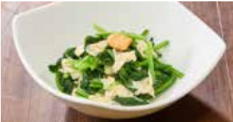
湯葉とほうれん草炒め 菠菜腐竹 / Stir-Fried Spinach with Yuba