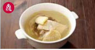
鶏肉蒸しスープ 元盅鶏湯 / House Steamed Chicken Soup