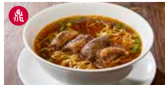
牛肉麺 (ニューローメン) 紅焼牛肉麵 / Braised Beef Noodle Soup