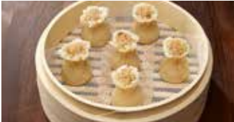
もちごめと豚肉入り焼売 糯肉焼売 / Steamed Sticky Rice and Ground Pork Shao Mai