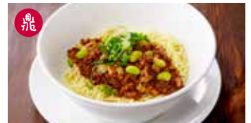
ジャージャー麺 (スープ付) 炸醬麵 / Noodle with Minced Pork Sauce