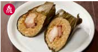
豚肉入りちまき 鮮肉粽子 / Sticky Rice Wrap with Pork