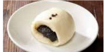
ゴマあん入りまんじゅう 芝麻大包 / Sesame Bun