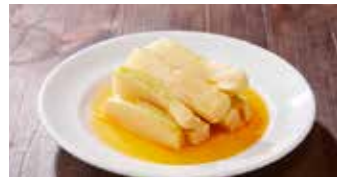
台湾産極太メンマ 台湾很厚笋子 / Taiwanese Thick Bamboo Shoot