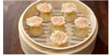
えびと豚肉入り焼売 蝦肉焼売 / Steamed Shrimp and Pork Shao Mai