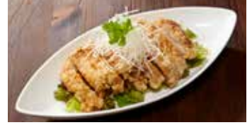
鶏肉の唐揚げ ユウリンソース 油淋鶏 / Fried Chicken with Salty-sweet Sauce