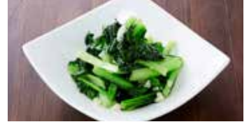
季節の青菜炒め ニンニク風味 炒青菜 / Stir-Fried Water Spinach