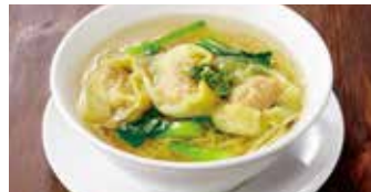
えびと豚肉入りワンタン麺 蝦肉餛飩麵 / Shrimp and Pork Wonton Noodle Soup