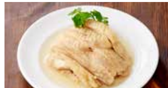
鶏肉の紹興酒漬け 紹興醉鶏 / Shaoxing Wine Marinated Chicken