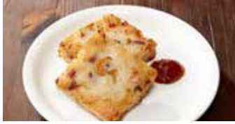
大根もち 蘿蔔糕 / Radish Rice Cakes