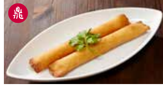
えび入り棒春巻き 蝦肉春捲 / Shrimp Stick Spring Roll