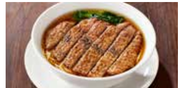
パイター麺 排骨麵 / Pork Chop Noodle Soup