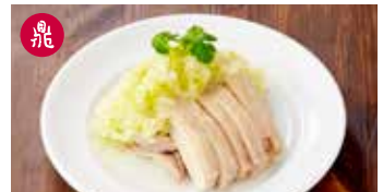
蒸し鶏 ねぎソース 葱油鶏 / Steamed Chicken with Leek Sauce