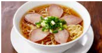
チャーシュー麺 叉焼麵 / Roast Pork Noodle Soup