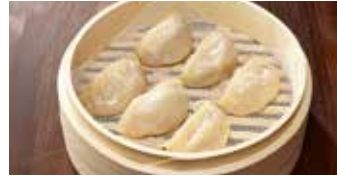
えびと豚肉入り蒸し餃子 蝦肉蒸餃 / Steamed Shrimp and Pork Dumplings