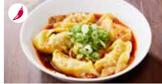
ピリ辛ゆでワンタン (えび入り) 紅油抄手 (蝦肉) / Spicy Shrimp and Pork Wonton