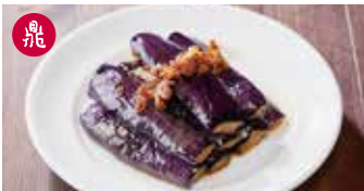
茄子の醤油煮 紅焼茄子 / Braised Eggplant