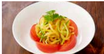
くらげの甘酢あえ 海蜇皮 / Jellyfish Tossed in Sweet Vinegar